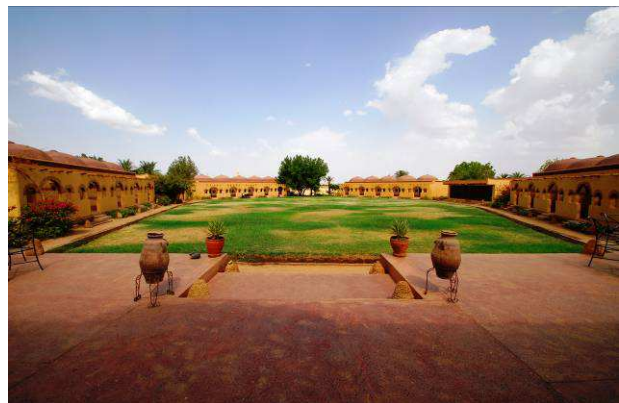
Nubian Resthouse en Karima

- En caso de haber disponibilidad substituiremos las 02 noches en el Meroweeland Resort por la Nubian Resthouse en Karima , un encantador hotel boutique decorado al estilo Nubio y situado a los pies del Jebel Barkal, con una agradable zona donde sentarse en las frescas noches estrelladas.