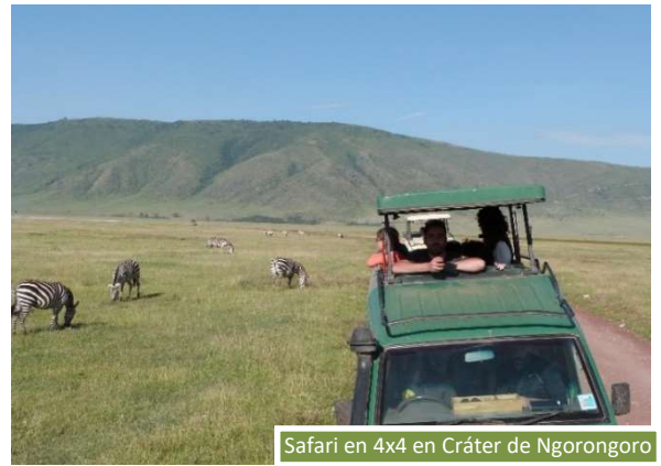
Safari en 4x4 en Cráter de Ngorongoro

Es la mejor despedida posible de la fauna africana. El Cráter del Ngorongoro tiene una altitud de 2200m y un diámetro de aproximadamente 20Km que lo convierten en una de las calderas más grandes del mundo. Descenderemos en vehículos 4x4 al volcán extinto, que, además de poseer una especial belleza por sus paisajes, nos brinda una excepcional manifestación de variedad y densidad de vida animal. Es llamado “El jardín del Edén” o el “Arca de Noé” por la fauna que nos podemos llegar a encontrar. Asimismo, esta zona está poblada por los maasai, que habitan en la base del volcán.