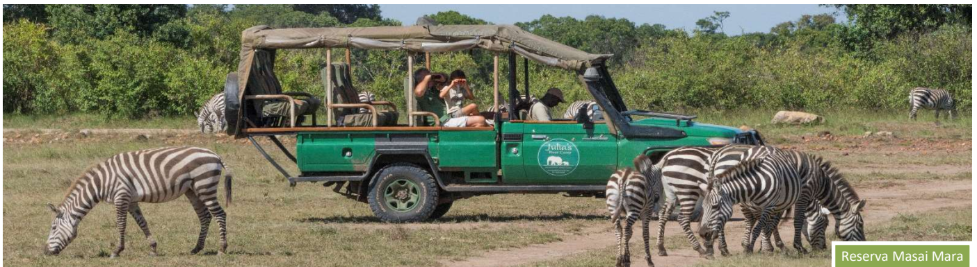
Reserva Masai Mara

En nuestros días en la reserva, aprovecharemos mucho las primeras horas de sol, así como las últimas, para poder ver a los animales del Mara en plena actividad y, si tenemos suerte, avistar a la Gran Migración cruzando el río Mara.