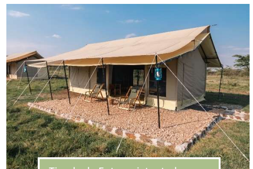
Tienda de Entepesi, tented camp

Gracias a nuestro campamento estratégicamente ubicado, podrás explorar los rincones más auténticos y menos transitados, disfrutando de safaris exclusivos al ritmo de nuestros 4x4.