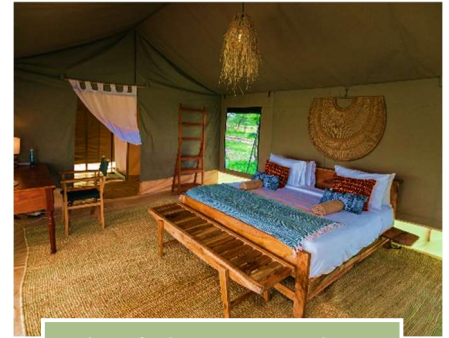
Habitación de Entepesi tented camp

La segunda noche será en Julia's River Camp inaugurado en 2012 con motivo de nuestro vigésimo aniversario. Se encuentra a orillas del Río Talek, un paraje fantástico en el que deleitarse mirando la puesta de sol con una copa de vino en la mano. Es importante tener en cuenta que estamos dentro de la reserva, a media hora en 4x4 del alojamiento más cercano, donde es fácil avistar elefantes, jirafas e incluso leones. ¡Un auténtico lujo!