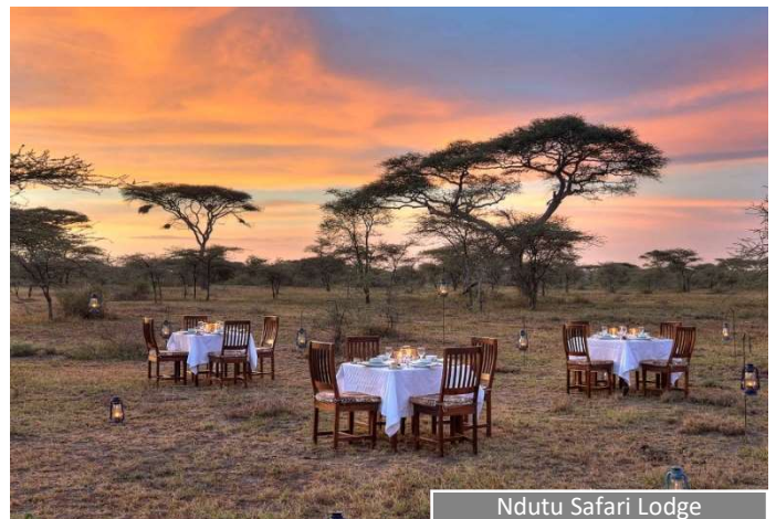
Ndutu Safari Lodge

Durante la temporada de migración, el lago atrae a una abundancia de vida silvestre, ya que actúa como una fuente esencial de agua. En la estación seca, es posible que el lago se seque, revelando un lecho de sal blanca. Nos alojaremos en Ndutu Safari Lodge, el lodge más antiguo de Tanzania. Fue la residencia de Jane Goodall, la renombrada primatóloga y conservacionista, junto con su esposo Hugo Van Lawick, cineasta que ayudó a popularizar el estudio de los chimpancés.