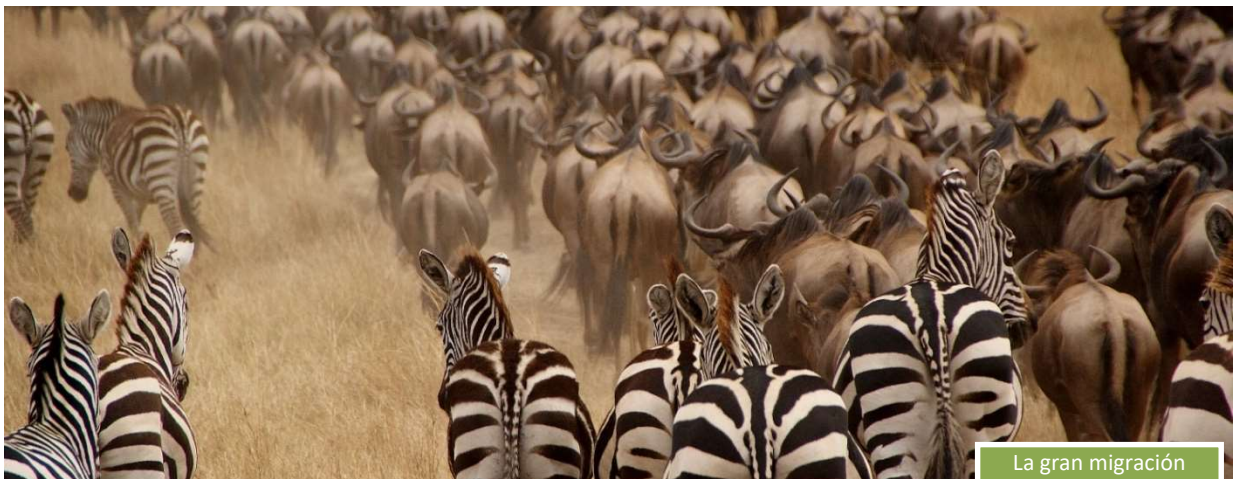
La gran migración