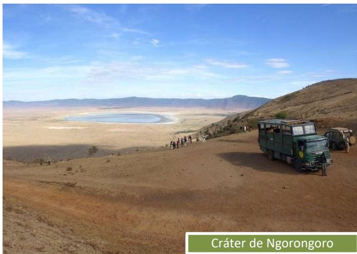
Cráter de Ngorongoro

El Cráter del Ngorongoro es una de las mayores calderas volcánicas extintas del mundo. Gracias a su inactividad casi milenaria, en su interior nos encontramos diversos ecosistemas, llanuras cubiertas de bosques, sabana y dos lagos, uno salado y uno de agua dulce. Cuenta con paredes de más de 600 metros de altura y 20 km 2 de diámetro.