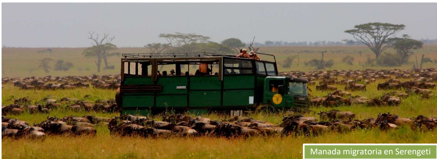
Manada migratoria en Serengeti