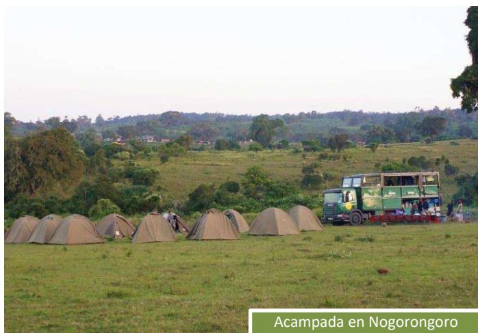
Acampada en Ngorongoro

Conocido como el arca de Noé, es el paraje de África con mayor densidad y variedad de fauna. Con nuestros 4x4 bajaremos hasta la caldera donde encontraremos todo tipos de animales desde rinocerontes, leones o jirafas, hasta avestruces, buitres o flamencos. El paisaje de este lugar es tan espectacular, que deja sin palabras.