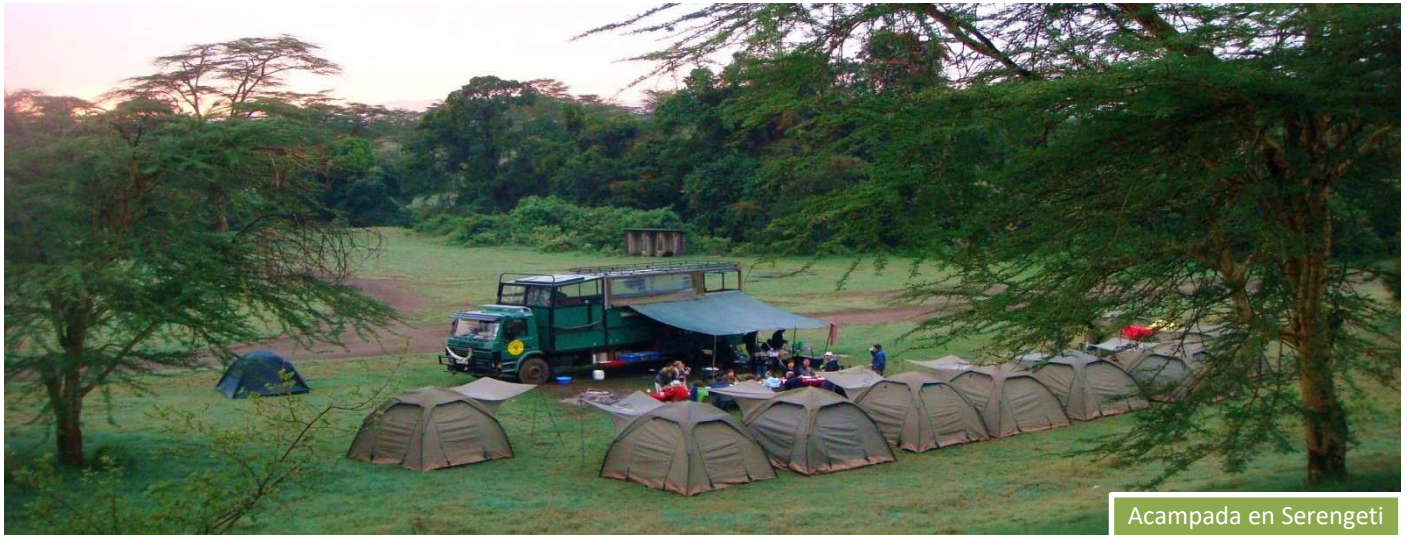
Acampada en Serengeti

Desde la migración que mueve a millones de ñus en busca de pastos frescos, hasta el constante espectáculo de depredador contra presa, la lucha por la supervivencia domina sus sabanas. Es la más impresionante y sobrecogedora manifestación de vida salvaje que pueda brindar la naturaleza. Realizando los mejores safaris durante las primeras horas de la mañana y las últimas de la tarde, cuando los animales salen en busca de alimento.