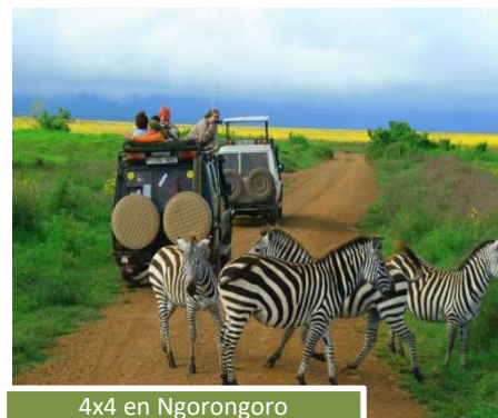
4x4 en Ngorongoro

La configuración interior del camión varía según la ruta.