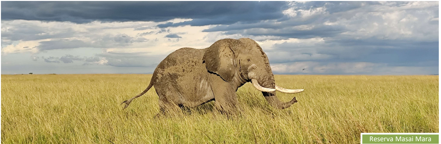
Reserva Masai Mara

VIT - VIATGES INDEPENDENTS I TREKKINGS, S.L. - NIF B65196164 - Domicilio social: Av. Diagonal 337, 08037 Barcelona Teléfono: 93 454 37 03 - E-mail: bcn@viatgesindependents.cat - www.viatgesindependents.cat