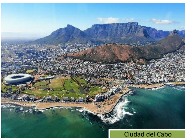
Ciudad del Cabo

Cape Town fue el puerto de entrada desde el que se colonizó toda África Austral, y hoy en día es una ciudad increíble, nacida de una mezcla de culturas sin igual. Es cosmopolita, pero a la vez alberga gran cantidad de arquitectura histórica y colonial, y barrios tradicionales.