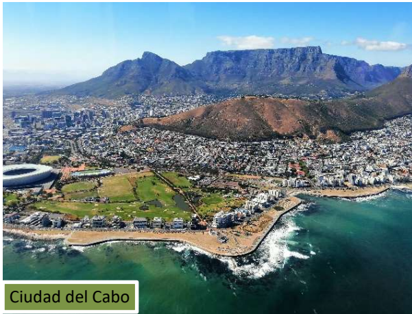
Ciudad del Cabo

Partimos a primera hora para visitar el cabo de Buena Esperanza. Transitaremos por una de las rutas panorámicas más impactantes de toda África, con acantilados majestuosos, vistas increíbles del océano, fauna única como avestruces y babuinos y el emblemático faro que domina esta histórica costa salvaje. ¡Además visitaremos a los pingüinos de Boulders Beach! Radisson RED Cape Town V&A Waterfront 4★ . Desayuno.