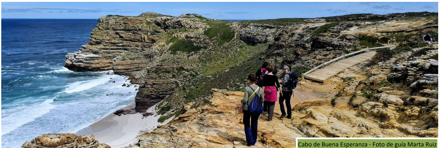
Cabo de Buena Esperanza

Es uno de los pocos sitios donde se puede observar a esta ave en peligro de extinción ( Spheniscus demersus ) de cerca, deambulando en un entorno natural protegido. El Jackass Penguin es la única especie de pingüino que se reproduce en África.