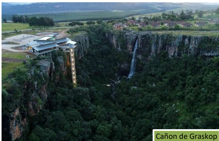
Cañon de Graskop

Considerado una de las maravillas naturales de África, el Blyde Canyon se encuentra situado en la región de Mpumalanga, muy cerca del Parque Nacional Kruger.