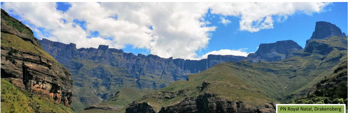
PN Royal Natal, Drakensberg

Mientras nos aproximamos al punto de partida de nuestro trekking, nos maravillaremos con la visión del ‘anfiteatro’, un muro montañoso compacto de más de 8km de longitud. Siguiendo el río Tugela, realizaremos un trekking de unas 6 horas a un ritmo tranquilo hasta alcanzar un lugar con vistas privilegiadas del maravilloso paisaje