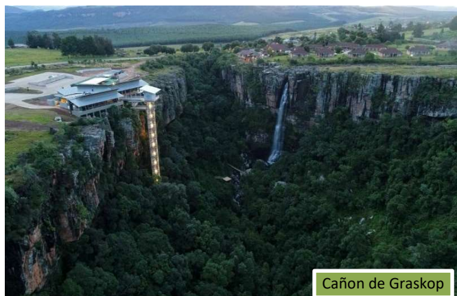
Cañón de Graskop

Considerado una de las maravillas naturales de África, el Blyde Canyon se encuentra situado en la región de Mpumalanga, muy cerca del Parque Nacional Kruger.