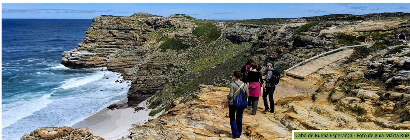
Cabo de Buena Esperanza

De regreso, pararemos en Simon's Town, donde descubriremos la famosa playa de Boulders y su colonia de pingüinos africanos. Es uno de los pocos sitios donde se puede observar a esta ave en peligro de extinción ( Spheniscus demersus ) de cerca, deambulando en un entorno natural protegido. El Jackass Penguin es la única especie de pingüino que se reproduce en África.