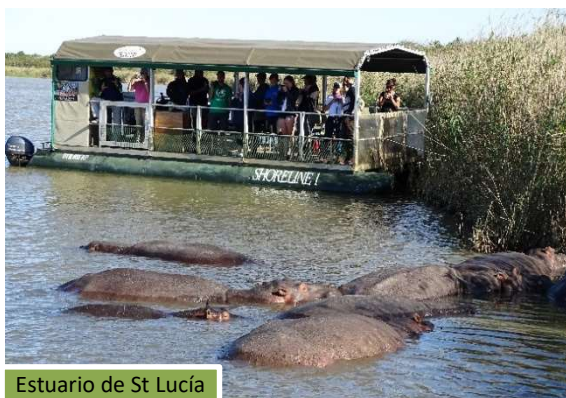
Estuario de St Lucía

El pequeño pueblo de Santa Lucía se erige entre su estuario y el mar. Es una población tranquila y puerta de entrada al PN Isimangaliso. Patrimonio de la Humanidad desde 1999, con 332.000 hectáreas es el cuarto parque más grande de Sudáfrica y uno de los más fascinantes. En él encontramos multitud ecosistemas interconectados: lagos, bosques, sabanas, manglares, islas de cañaverales, pantanos de papiro, dunas de costa (de las más altas del mundo), playas y el mayor estuario interior de África, conocido por tener la mayor concentración de cocodrilos de todo el país. A nuestra llegada, navegaremos por el estuario en nuestra barca recorriendo las selvas y prados que lo flanquean y encontrándonos con la fauna que lo puebla: pelícanos, flamencos, hipopótamos y cocodrilos.