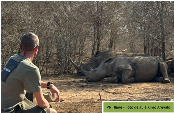
PN Hlane

Más pequeño en extensión que el Parque Nacional de Kruger, el Reino de Eswatini es uno de los países más menudos de África y, sin embargo, alberga en su interior lo más variado de los paisajes africanos. Es una de las pocas monarquías absolutistas del mundo que todavía pervive y que ha conseguido conservar muchas de sus costumbres ancestrales.