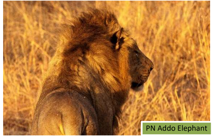
PN Addo Elephant

Realizaremos 2 safaris en vehículos 4x4 y acompañados de guías especialistas. Uno por la mañana y otro por la tarde, de 2 horas de duración cada uno.