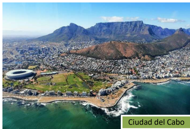
Ciudad del Cabo

¡Es considerada una de las ciudades más bonitas del mundo! Cape Town fue el puerto de entrada desde el que se colonizó toda África Austral, y hoy en día es una ciudad increíble, nacida de una mezcla de culturas sin igual. Es cosmopolita, pero a la vez alberga gran cantidad de arquitectura histórica y colonial, y barrios tradicionales.