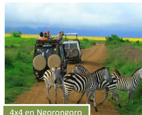
4x4 en Ngorongoro