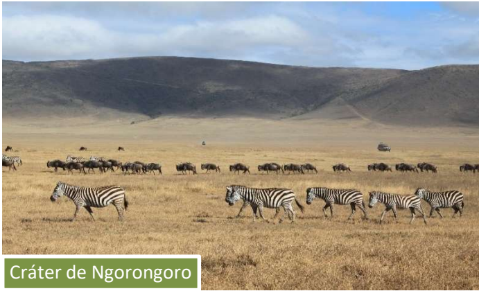
Cráter de Ngorongoro

El Cráter del Ngorongoro es una de las mayores calderas volcánicas extintas del mundo. Gracias a su inactividad casi milenaria, en su interior nos encontramos diversos ecosistemas, llanuras cubiertas de bosques, sabana y dos lagos, uno salado y uno de agua dulce. Cuenta con paredes de más de 600 metros de altura y 20 km 2 de diámetro.