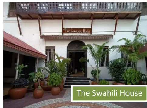
The Swahili House

Es muy importante respetar el horario de salida del minibús hacia el aeropuerto de Zanzíbar. El minibús partirá a la hora prevista y no podrá esperar a los que no estén.