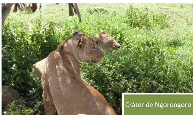
Cráter de Ngorongoro

El Cráter del Ngorongoro es una de las mayores calderas volcánicas extintas del mundo. Gracias a su inactividad casi milenaria, en su interior nos encontramos diversos ecosistemas, llanuras cubiertas de bosques, sabana y dos lagos, uno salado y uno de agua dulce. Cuenta con paredes de más de 600 metros de altura y 20 km 2 de diámetro. Conocido como el “Arca de Noé”, es el paraje de África con mayor densidad y variedad de fauna. Con nuestros 4x4 bajaremos hasta la caldera donde encontraremos todo tipos de animales desde rinocerontes, leones o búfalos, hasta avestruces, buitres o flamencos. El paisaje de este lugar es tan espectacular, que deja sin palabras.