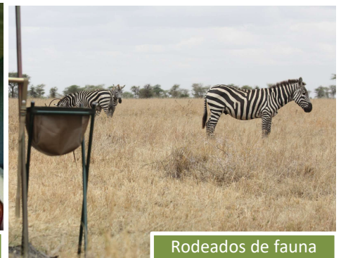
Rodeados de fauna