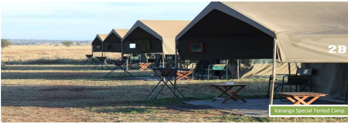
Kananga Special Tented Camp

El final idóneo de cada jornada intensa en el Serengeti será nuestro alojamiento KANANGA SPECIAL TENTED CAMP, en Seronera, pleno centro del Parque Nacional. Éste fue nuestro primer tented camp, que inauguramos en 2007. Así, en mitad de la sabana, solos y bajo un manto de estrellas, gozaremos de 2 noches mágicas. Las puestas de sol de África, en medio de impresionantes y silenciosos escenarios naturales y la posterior cena y charla alrededor de la hoguera crearán, sin duda, momentos únicos e inolvidables.