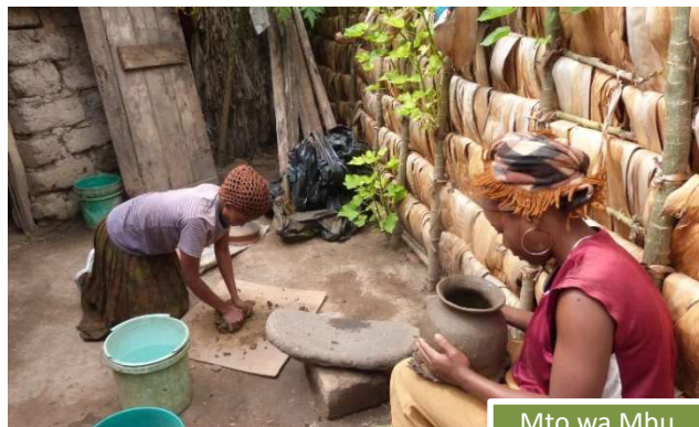
Mto wa Mbu

Cercana al Lago Manyara, la población de Mto Wa Mbu sale a nuestro encuentro para deleitarnos con su día a día. Tendremos la oportunidad de conocer la vida rural de los lugareños; veremos las plantaciones de bananas, los artesanos tallando las famosas estatuas Makonde, como pintan los cuadros artesanalmente o las mujeres moldeando la arcilla para convertirla en cuencos o vasijas. Nuestro paso por esta población nos permitirá, más allá del exotismo de los parques con su fauna, conocer de primera mano la vida cotidiana de la gente africana. Esta temporada seguimos escogiendo un alojamiento privilegiado, el Lake Manyara Wildlife Lodge. Éste se sitúa en un excelente enclave desde donde podremos disfrutar de las fantásticas vistas mientras nos bañamos en la piscina. Lake Manyara Wildlife Lodge cuenta con espaciosas habitaciones con balcón privado y con una decoración totalmente africana.