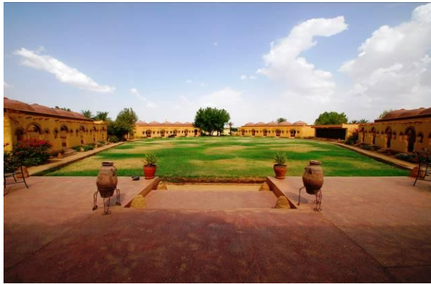
Nubian Rest House en Karima