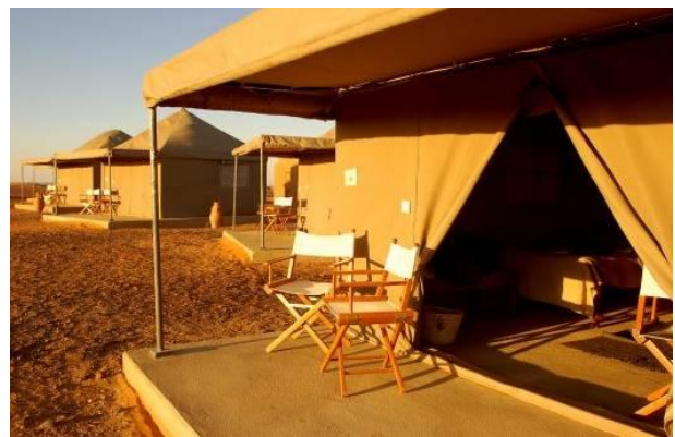
Campamento en Meroe