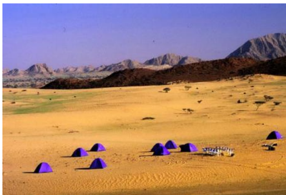
Campamento permanente en Tombos

Meroe. Con vistas a las famosas pirámides de Meroe, el campamento cuenta con 22 tiendas con camas twin. Cada tienda tiene su propio baño privado y ducha que se encuentra en una cabaña separada en la parte posterior de la tienda.