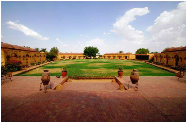
Nubian Resthouse en Karima

Con vistas a las famosas pirámides de Meroe, cuenta con 22 tiendas con camas twin. Cada tienda tiene su propio baño privado y ducha que se encuentra en una cabaña separada en la parte posterior de la tienda. Hay un restaurante interior para poder comer afuera en las agradables tardes de primavera. El campamento tiene un generador de energía que funciona todos los días hasta las 22.30 - 23.00h. El campamento está abierto desde octubre hasta finales de abril.