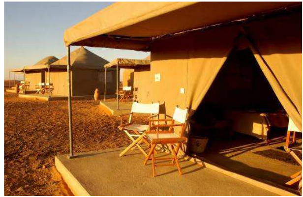
Campamento en Meroe